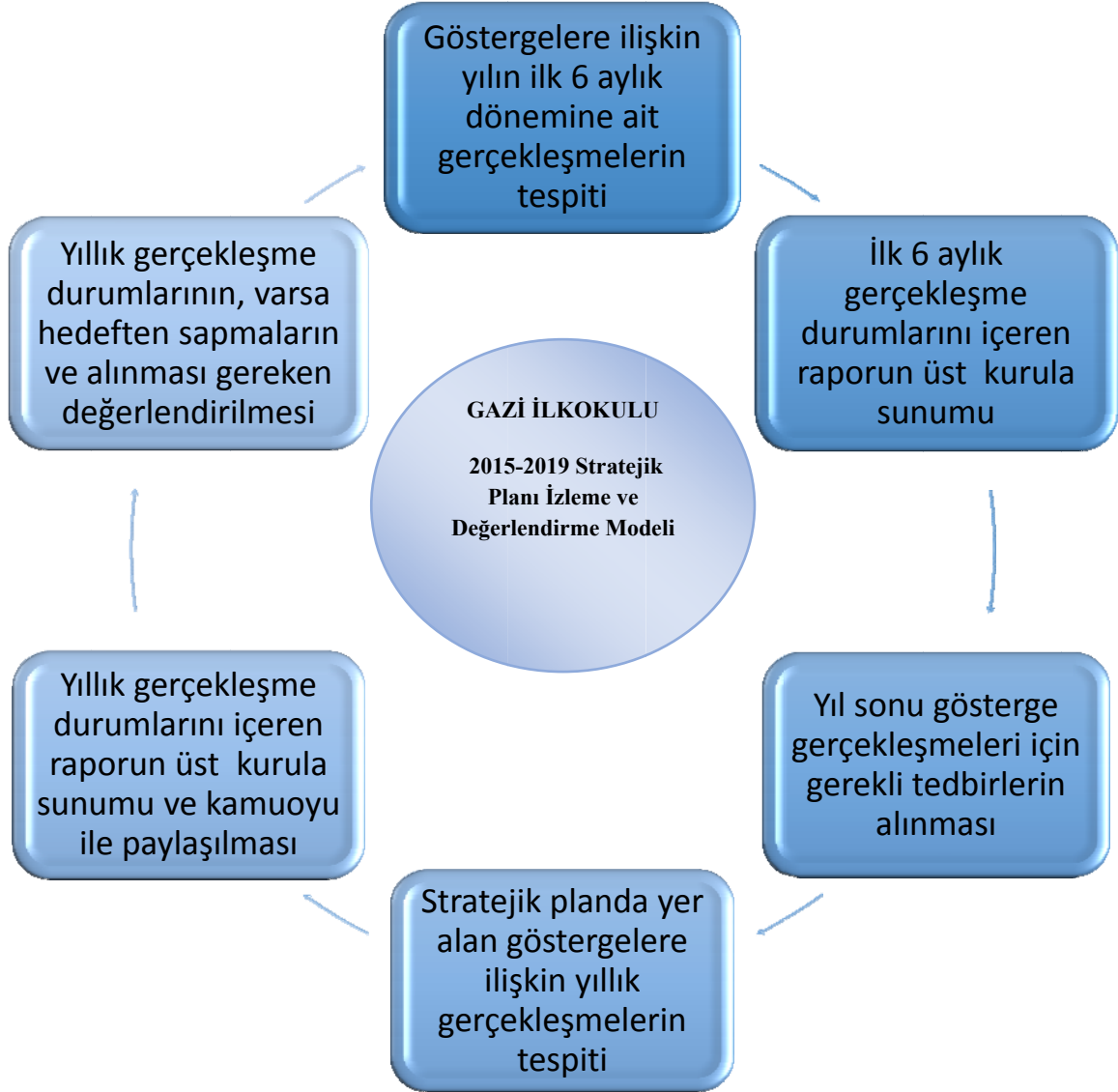
Şekil 1: Stratejik Planı İzleme ve Değerlendirme Modeli